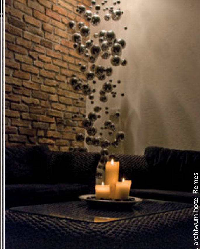
☐ Spa wypoczynek