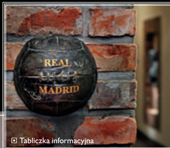
☐ Tabliczka informacyjna

Obiekt o rozbudowanym zapleczu sportowym