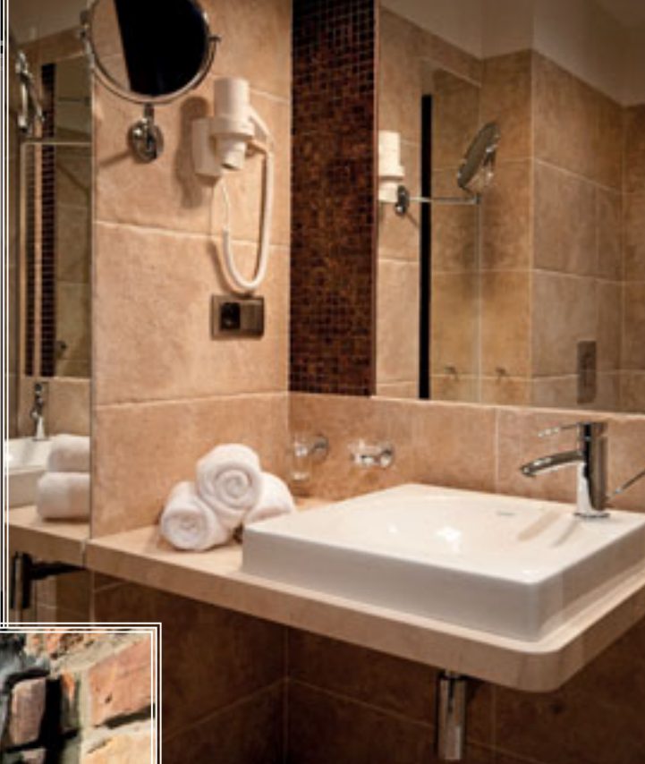
☐ Jedna z łazienek

Czy rozwiązanie funkcji i programu obiektu było podyktowane tym, że budynek ma służyć przygotowaniu reprezentacji biorących udział w Euro 2012?