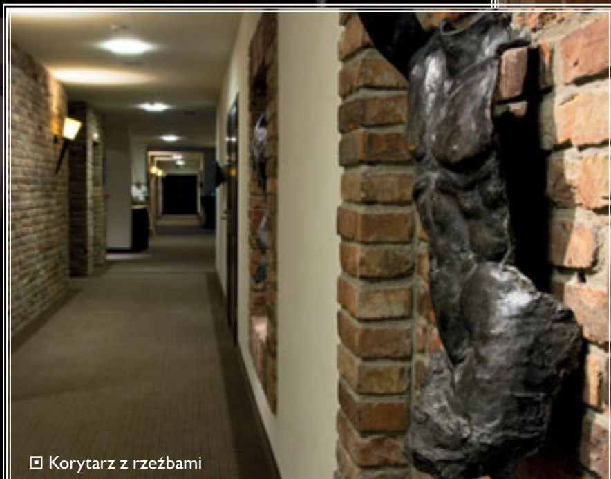
☐ Korytarz z rzeźbami

JP: Zaprojektowane elementy rzeźbiarskie, pojawiające się w różnych częściach hotelu, są artystyczną ilustracją programu hotelu nawiązującego do klasycznych ideałów sportu