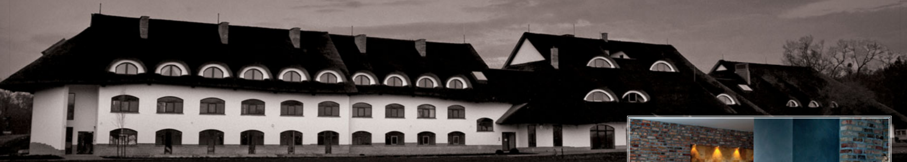
☐ Panorama kompleksu