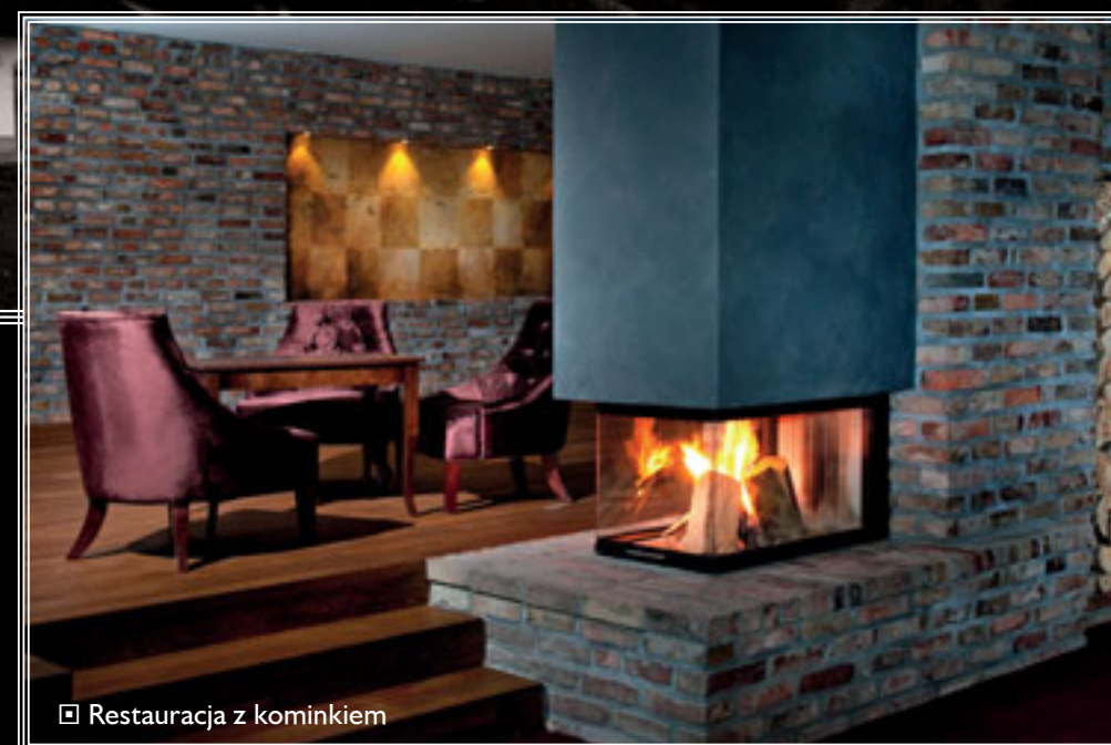
☐ Restauracja z kominkiem

Współpraca z inwestorem, który jest tak mocno związany z piłką nożną, warunkowała konkretne założenia projektowe oraz detale wyposażenia?