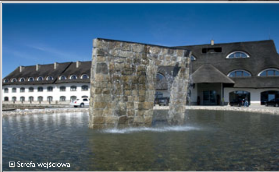
□ Strefa wejściowa

z akcentem na wątek antyczny. Kinkiety komponują się z innymi elementami wystroju wnętrz, ponadto – pomimo swojej okazałej formy – są stosunkowo neutralnym źródłem światła skojarzonym z ciepłem, jakie daje tradycyjna pochodnia.